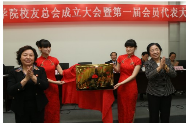
▲ 黄河科技学院校友总会隆重成立 04