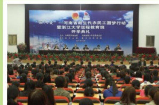
省新生代农民工圆梦行动 首届学员开班仪式在我校举行