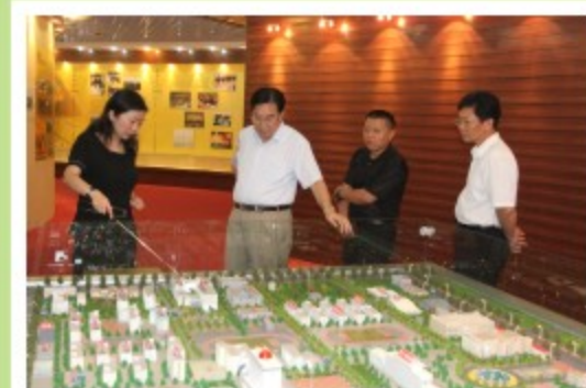
原国家人事部副部长徐颂陶参观我校