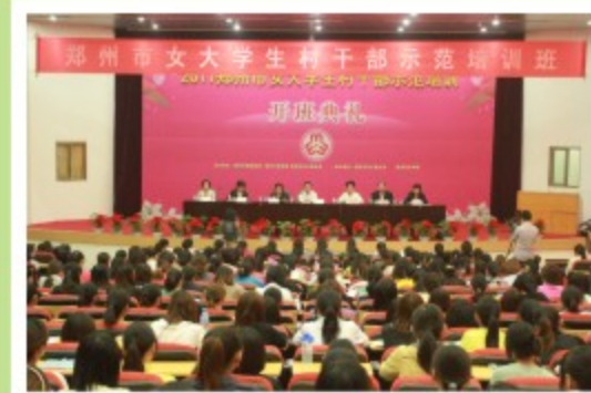
郑州女大学生村干部培训班 在我校开课