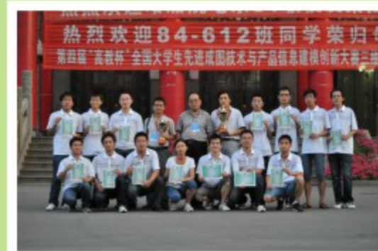
第四届“高教杯”全国大学生成图技术与信息建模大赛圆满落幕 我校工学院两支代表队勇创佳绩